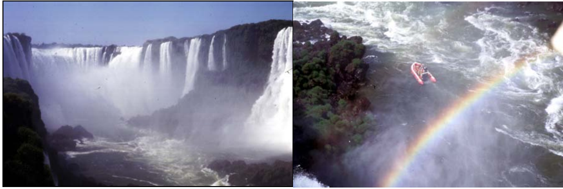
Abb. 7: An den Iguacu-Wasserfälle

Die Reiseroute führte von Curitiba, der Hauptstadt von Paraná, zunächst mit dem Zug durch die Mata Atlantica in die Küstenebene, sodann Richtung Westen über die verschiedenen Höhenstufen (Planaltos) nach Ponta Grossa und weiter in die erst in den 1960er Jahren entstandene Universitätsstadt Maringá. Dort nahmen die Studierenden an einem Symposium zur deutschen geographischen Forschung in Lateinamerika teil. Fahrten von Maringá aus führten uns die Problematik großbetrieblichen Landwirtschaft wie umgekehrt der Landlosen in Brasilien vor Augen. In der weit im Westen, in der Nähe der Grenze zu Paraguay gelegenen Universitätsstadt Maréchal Candido Rondon wurden wir herzlich von den dortigen Geographen/innen aufgenommen und die folgenden Tage zu einigen Exkursionshighlights wie den Iguacu-Wasserfällen und den Itaipu-Wasserkraftwerken sowie zu Gaucho-Tänzen und Guarani-Indianern begleitet. Die letzte Phase der Exkursion war dem „deutschen“ Brasilien im Süden von Paraná und in Santa Catarina mit Besuch des „Oktoberfests“ in Blumenau und zwei Tagen im südlichen Florianopolis gewidmet.