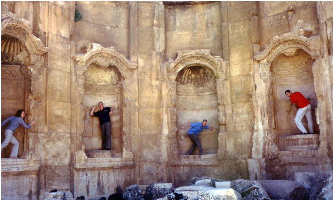
Abb. 5: Studierende als Statuen in den Trümmern von Baalbek/Libanon

Wesentliche Programmpunkte und Highlights im Libanon waren der Wiederaufbau der im libanesischen Bürgerkrieg teilweise zerstörten Hauptstadt Beirut, eine ganztägige Wanderung im Libanongebirge, Fahrten in die Bekaa-Ebene und den malerischen Suq von Tripoli (mit Kartierung im Rahmen eines Praktikumstages), insbesondere aber die Fahrt zur UN-Friedenstruppe im Südlibanon, der bis 2000 israelisch besetzt war, sowie ein Besuch bei der United Nations Relief and Works Agency in Beirut mit einem Rundgang durch die Palästinenserlager Shatila oder Burj al-Barajneh.