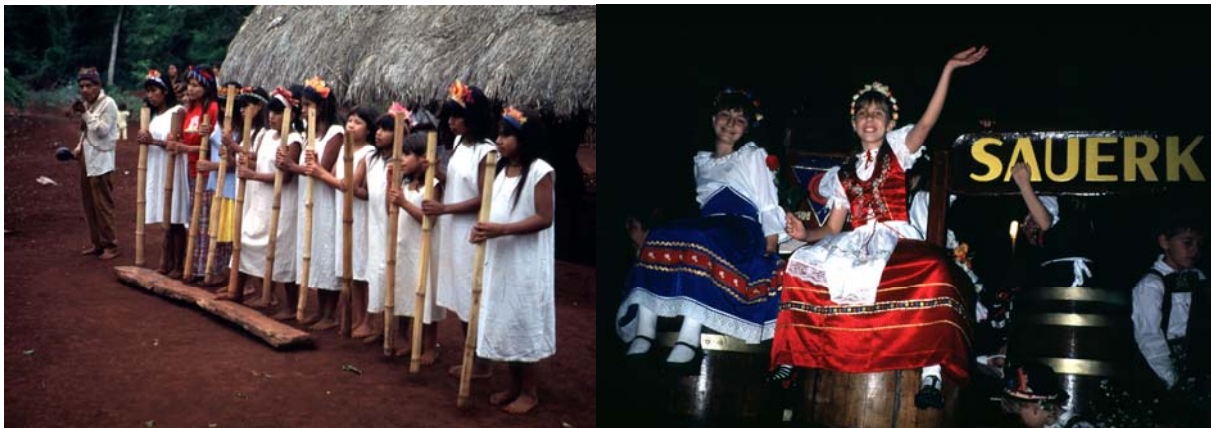
Abb. 8 und 9: Guarani-Indianer

Die Reiseroute führte von Curitiba, der Hauptstadt von Paraná, zunächst mit dem Zug durch die Mata Atlantica in die Küstenebene, sodann Richtung Westen über die verschiedenen Höhenstufen (Planaltos) nach Ponta Grossa und weiter in die erst in den 1960er Jahren entstandene Universitätsstadt Maringá. Dort nahmen die Studierenden an einem Symposium zur deutschen geographischen Forschung in Lateinamerika teil. Fahrten von Maringá aus führten uns die Problematik großbetrieblichen Landwirtschaft wie umgekehrt der Landlosen in Brasilien vor Augen. In der weit im Westen, in der Nähe der Grenze zu Paraguay gelegenen Universitätsstadt Maréchal Candido Rondon wurden wir herzlich von den dortigen Geographen/innen aufgenommen und die folgenden Tage zu einigen Exkursionshighlights wie den Iguacu-Wasserfällen und den Itaipu-Wasserkraftwerken sowie zu Gaucho-Tänzen und Guarani-Indianern begleitet. Die letzte Phase der Exkursion war dem „deutschen“ Brasilien im Süden von Paraná und in Santa Catarina mit Besuch des „Oktoberfests“ in Blumenau und zwei Tagen im südlichen Florianopolis gewidmet.