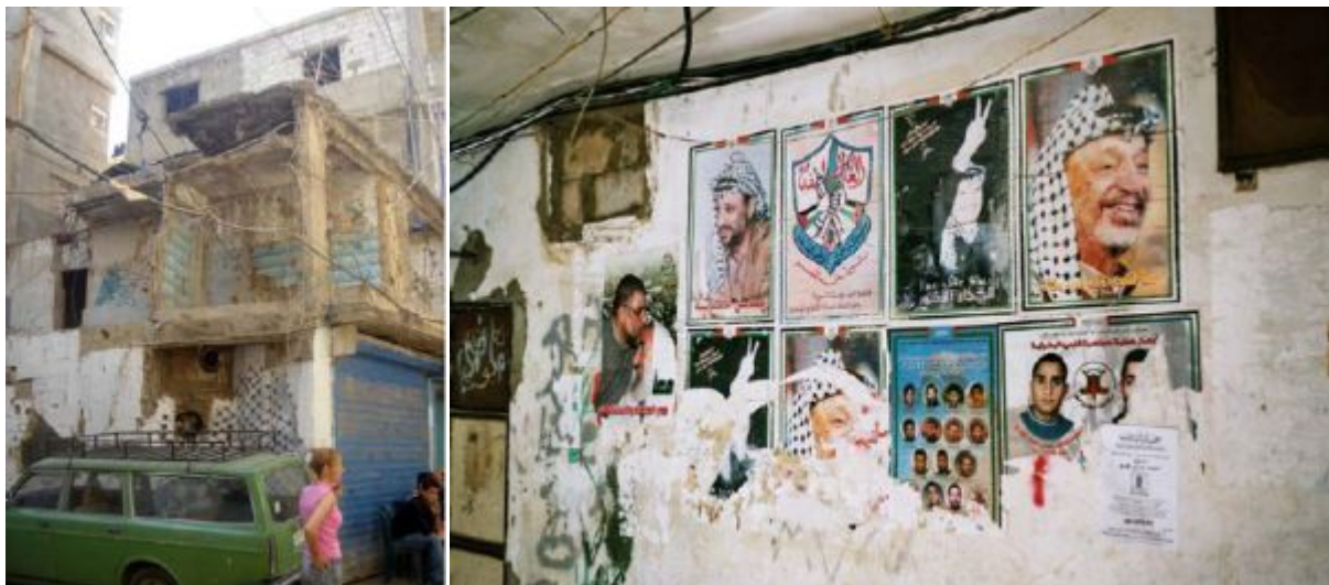
Flüchtlingslager Chatila in Beirut

Nach dem Abschluss ihrer Masterarbeit über die palästinensischen Flüchtlingslager im Libanon begann Leila Mousa mit ihrem Dissertationsprojekt zur geographischen Konfliktforschung