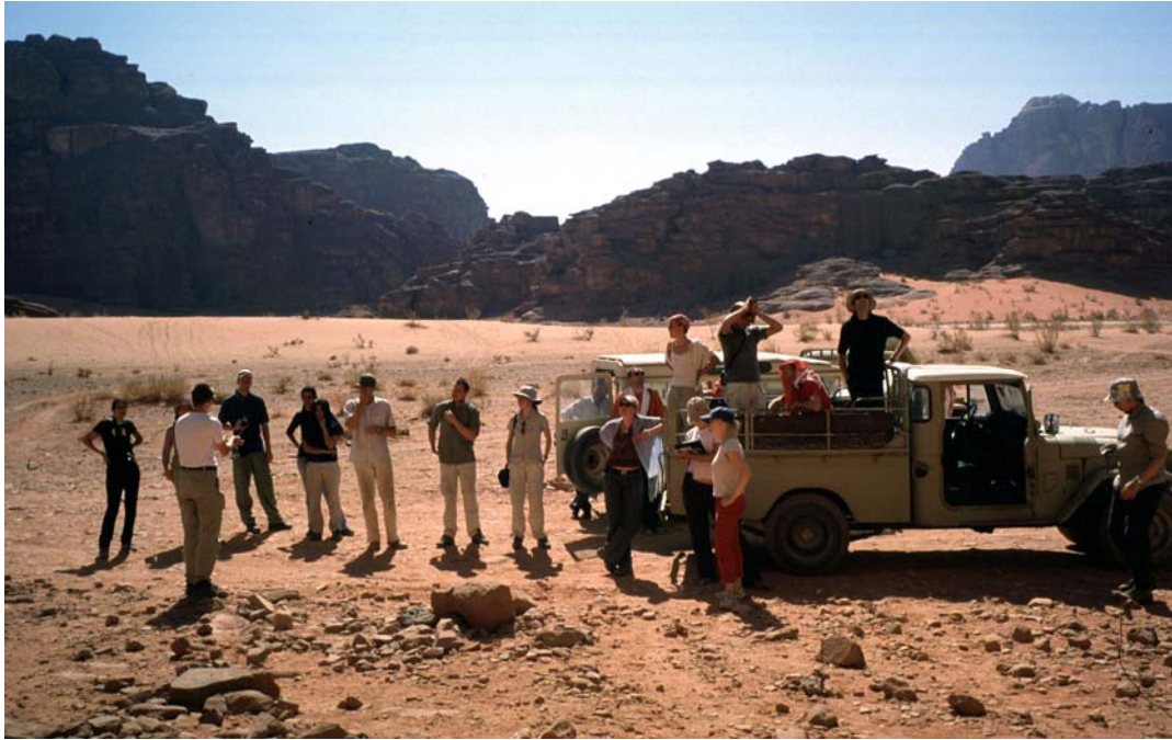
Abb. 6: Die Exkursionsgruppe im Wadi Rum

Von der am Roten Meer gelegenen Hafenstadt Akaba brachte uns eine Fähre auf die Sinai-Halbinsel. Exkursionshöhepunkte hier waren der Besuch des Katharinenklosters und des Naturparks Ras Muhammed an der Südspitze der Halbinsel sowie natürlich das Korallentauchen am Roten Meer.