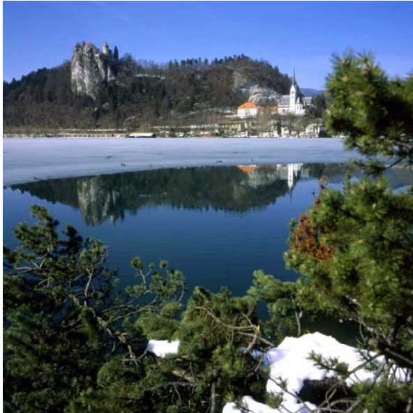
Abb. 6: Blejsko Jezero