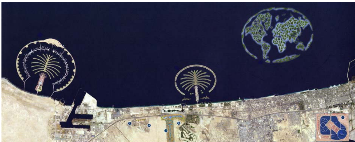
Abb. 4: Geplante künstliche Wohnwelten vor der Küste von Dubai

Gewaltige Investitionen im Immobilien- und Tourismussektor sowie stark ansteigende Tourismus- und Zuwanderungszahlen haben in Las Vegas und Dubai zu einem anhaltenden Wirtschaftsboom geführt. Gleichzeitig ist vor dem Hintergrund einer (new) Urban Governance und der Übertragung von Kompetenzen an private und semi-staatliche Akteure in beiden Metropolen ein rasanter Stadtumbau mit unzähligen Erlebnis-, Einkaufs- und Kunstwelten initiiert worden. Städte, die durch eine weitgehende Inszenierung der Lebenswelt und vor allem eine „Ökonomie der Faszination“ geprägt sind: Kasino- und Hotellandschaften, die verschiedene Schauplätze vom antiken Rom bis zum heutigen New York simulieren, künstliche Inseln in Gestalt von Palmen oder ganzen Weltkarten sowie weitere Superlative in Form von thematisch inszenierten Einkaufszentren und Sportarenen sind die augenscheinlichsten Folgen dieser rasanten Entwicklung. Las Vegas und Dubai sind damit nicht nur Vorreiter einer allgemeinen Kommerzialisierung und Erlebnisorientierung im Zeitalter wirtschaftlicher und kultureller Globalisierung, sondern auch Extrembeispiele einer postmodernen Stadtentwicklung.