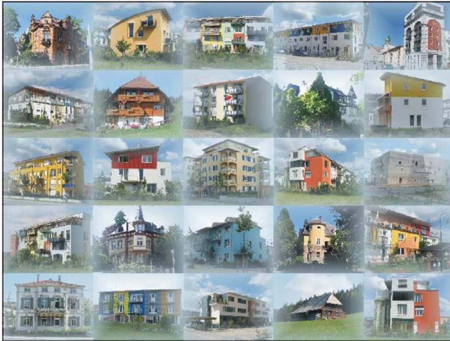
Abb. 1: Die Wohnung „fürs Leben“?

Die Befragung zeigte, dass 80% Wohneigentum anstreben. Mehr als 70% der Befragten sehen den attraktivsten Gebäudetyp im freistehenden Einfamilienhaus. Es wird häufig mit einer großen Wohnfläche, einem Garten, einer Garage und einem angenehmen Wohnumfeld in Verbindung gebracht. Jedoch geht die Hälfte derer, die das Eigenheim favorisieren, davon aus, dieses niemals verwirklichen zu können. Dementsprechend plant weniger als ein Viertel der Probanden einen Neubau. Gleichwohl sind moderne Gebäude nicht unbeliebt. 30% der Befragten wollen in einem nach 1985 errichteten Haus wohnen. Die Mehrheit (39%) wünscht sich aber einen Altbau von vor 1945. Mehr als drei Viertel erachten sie für attraktiv. An zweiter Position liegt mit dem Loft eine jüngere Wohnform, die insgesamt 45% der Befragten anspricht, dicht gefolgt vom feudalen Villenanwesen. Im Gegensatz zum Einfamilienhaus und den anderen vorgegebenen Wohnformen, gehen die Befürworter überwiegend (84%) davon aus, dass sie den Wunsch nach einer Altbauwohnung tatsächlich verwirklichen können.