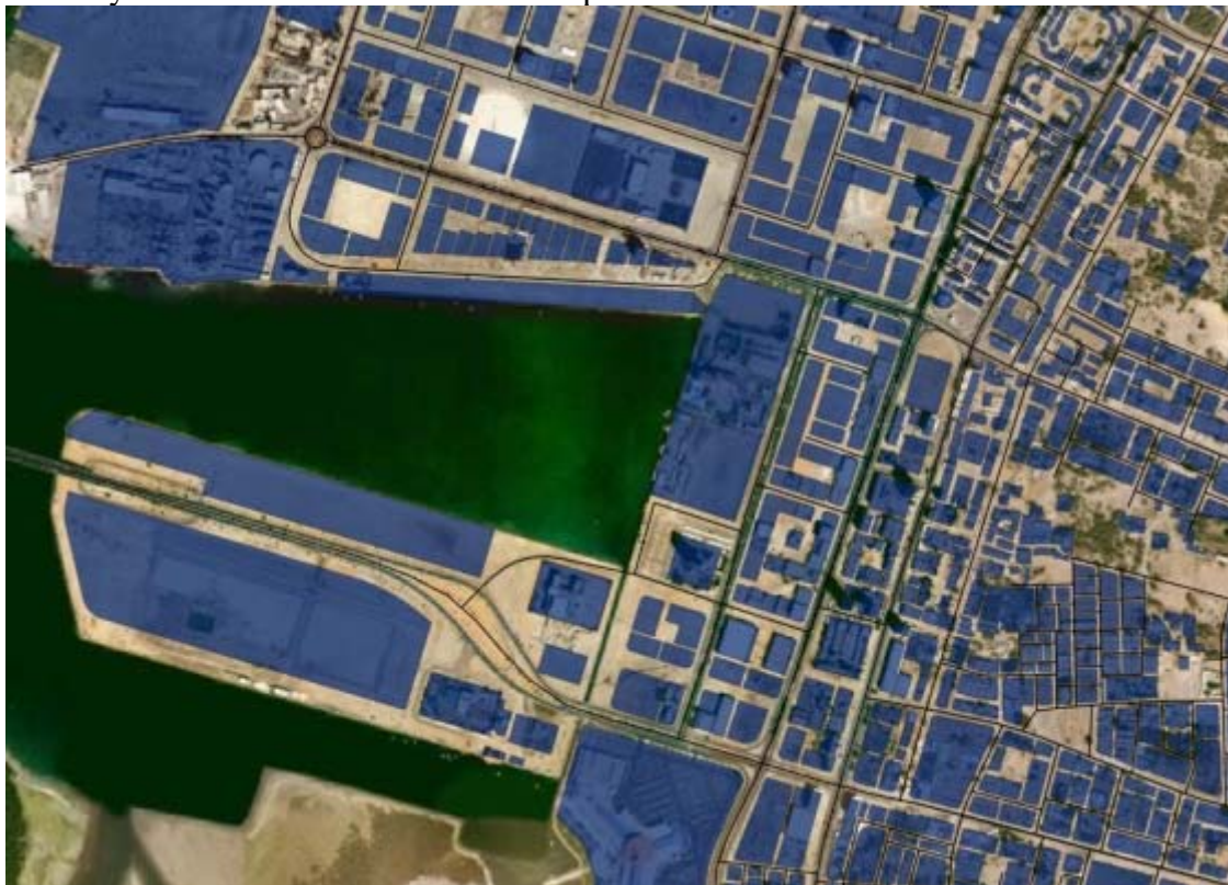
Detailausschnitt mit Straßen-, Gebäude- und Luftbildlayer für das Adressierungssystem